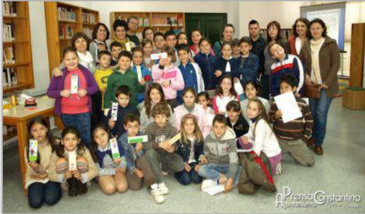
Alumnos de 3º de Primaria del C.E.I.P. Valle de la Osa