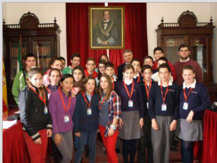
Nuestros jóvenes parlamentarios 2014/2015

Una experiencia de participación democrática que contribuye a crear futuros ciudadanos comprometidos con la realidad social y política de su localidad.