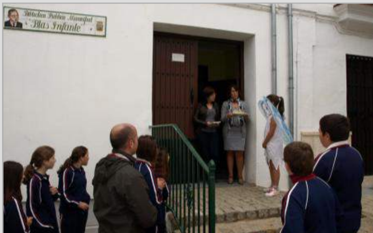
Momento de entrega de los libros del Ayuntamiento al Colegio Sagrado Corazón de Jesús

Por su parte, los alumnos de Primaria del Colegio Sagrado Corazón de Jesús realizaron una original cadena humana desde su centro escolar hasta la Biblioteca Pública Municipal. Guiados por las "hadas de la lectura" fueron pasando un libro, uno a uno, desde su colegio hasta la biblioteca y allí, nuestras concejales le hicieron entrega de un lote de libros que volvieron a pasar, de uno en uno, hasta su colegio, llevando a cabo, de esta forma, un intercambio simbólico de libros entre los dos organismos.