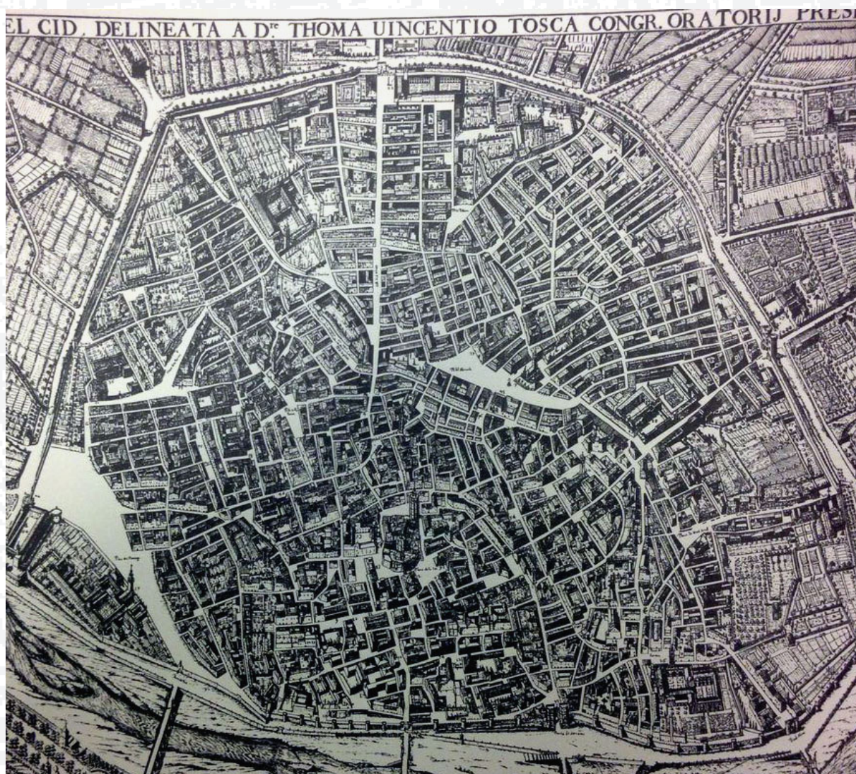
Mapa de Valencia del Padre Tosca (1704)

Por eso torció el gesto cuando, paseando por la galería del Palacio del Real a la espera de que le recibiera el virrey, vio cómo el carruaje del arzobispo cruzaba a toda velocidad bajo el portal mayor de la torre de los Ángeles, que marcaba la inconfundible silueta de la fortificación regia.»