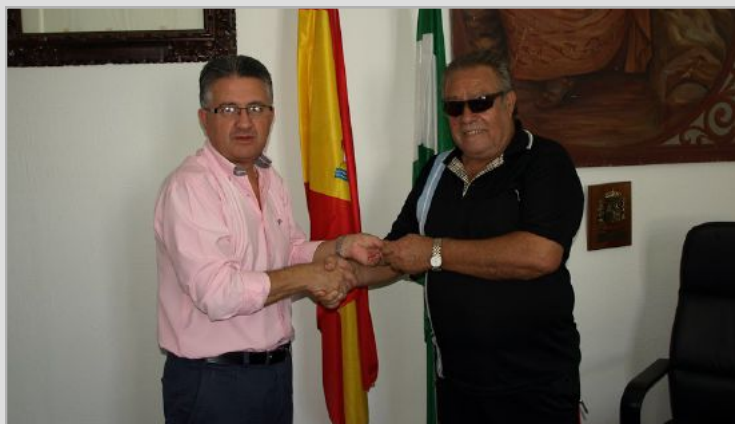
Diabéticos de Constantina