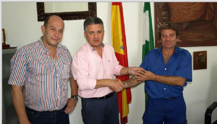
Alcohólicos Anónimos de Constantina

El Alcalde ha hecho entrega de las llaves de los locales que les cede el Ayuntamiento a dos nuevas asociaciones en el Edificio Lorenzo Irisarri para que los usen como sede, demostrando de esta forma su apoyo al asociacionismo.